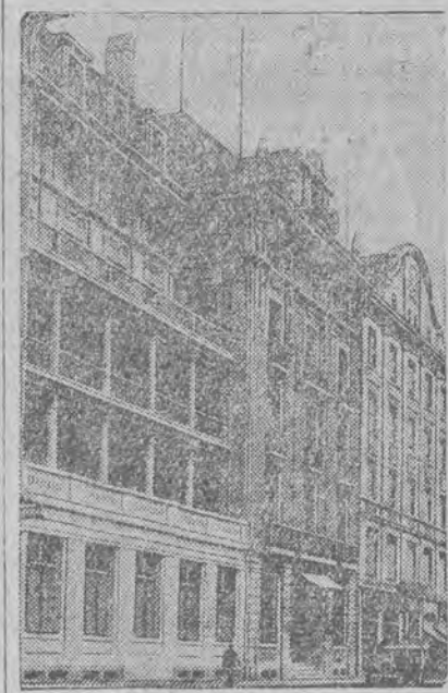
Gmach Banku Międzynarodowych Wypłat w Bazylei

na konferencję londyńską wskazuje, że będzie ona miała charakter wybitnie polityczny, chociaż podłoże jej będzie ściśle finansowe.