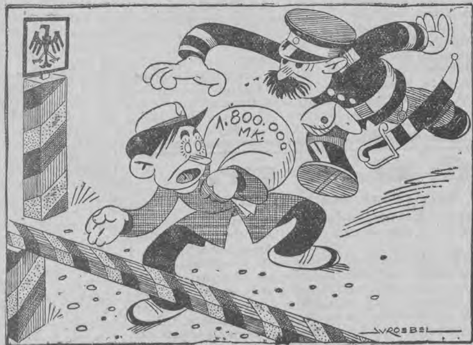
mające na celu uchwycenie kaptali, uciekających zagranicę.