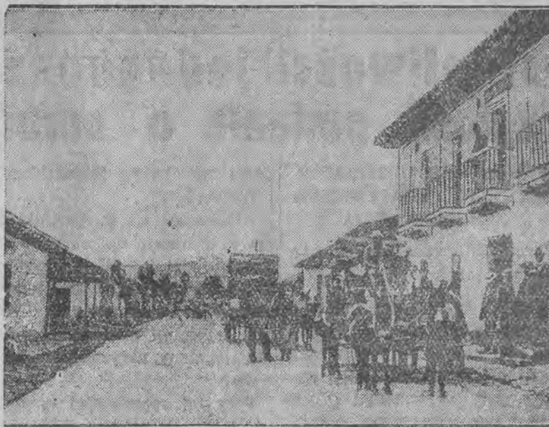
zrównało z ziemią miasteczko Latacunga w Ekwadorze, liczące 20 tysięcy mieszkańców. Ilość zabitych nie została dotychczas ustalona