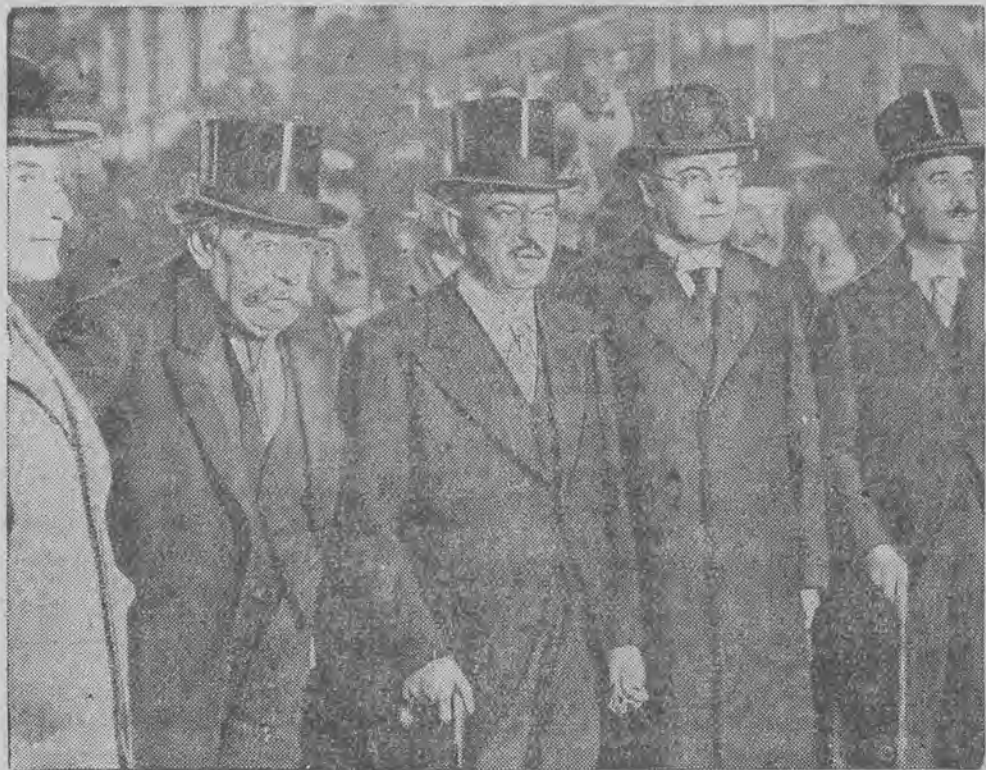
Powitanie na dworcu. Od lewej: dr. Curtius — Briand — Laval — Brüning