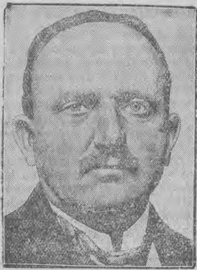
wybitny chemik, który w ubiegłym roku otrzymał nagrodę Nobla, kończy w tych dniach 50 lat.