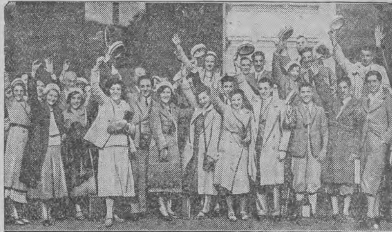
przybyli z wycieczką do Europy środkowej