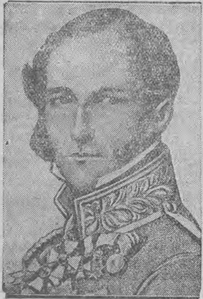
pod którego władzą utworzyło się przed 100 laty królestwo belgijskie