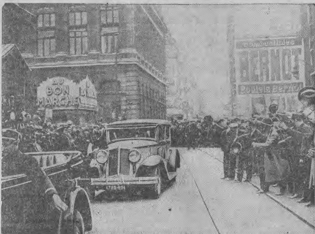
Tłumy publiczności witają owacyjnie gości niemieckich, udających się z dworca samochodem do ambasady Rzeszy