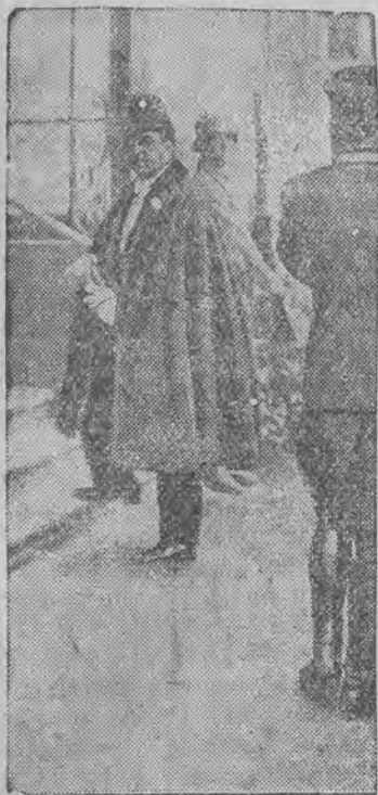
nowy poseł Afganistanu przy rządzie Rzeszy.