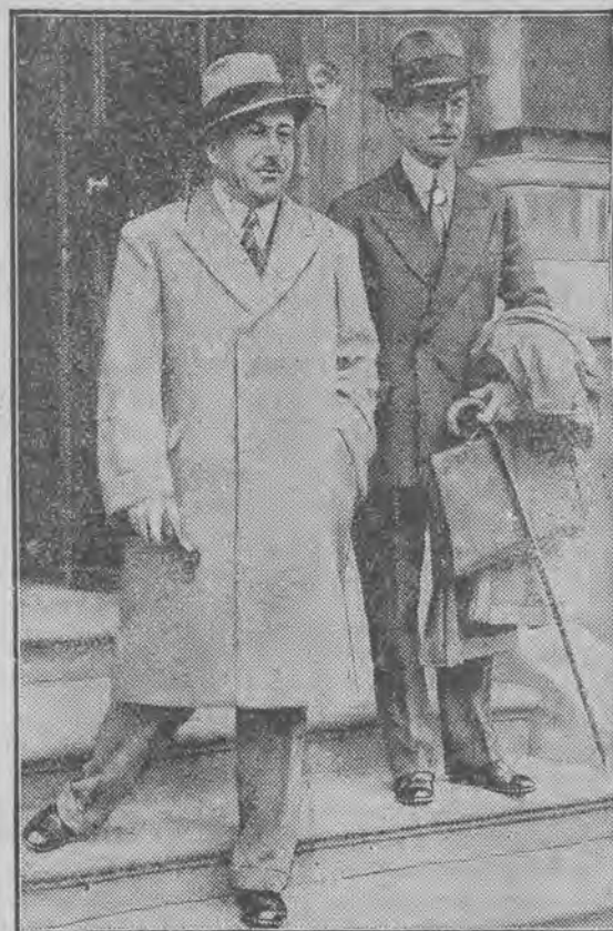
na konferencji rzeczoznawców dla zrealizowania planu Hoovera, Beneduce i Lanino, przed gmachem ministerstwa skarbu w stolicy Anglii