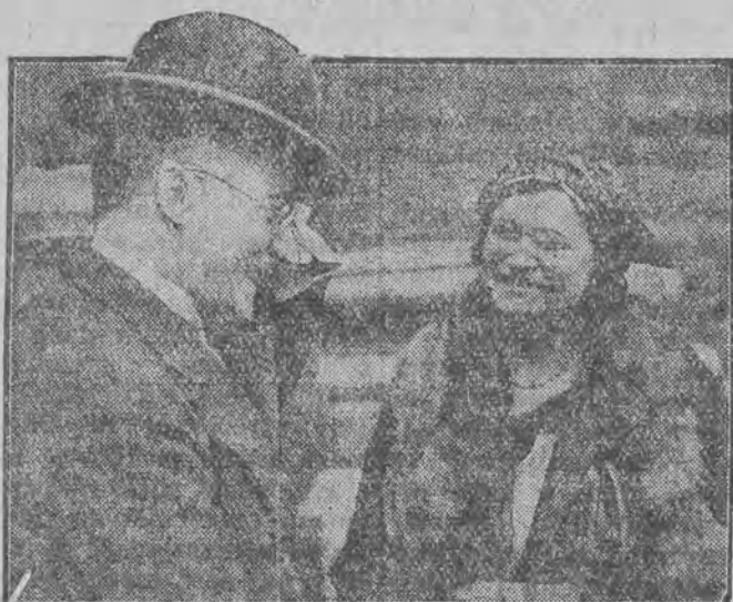
Rzadkie zdjęcie kanclerza Niemiec przy rozmowie z pewną damą w Londynie.

czynności: wytoczenie skargi lub wniosku o klauzulę egzekucyjną; zgłoszenie roszczenia wekslowego w postępowaniu układowym lub upadłościowym; oznajmienie sporu lub przyznanie ze strony pozwanego, oraz uznanie piśmienne roszczenia wekslowego.