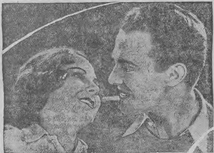
BESSIE LOVE , bohaterka wielu dramatów po raz pierwszy w wesołej i pełnej humoru roli, jako swawolna studentka wkrótce w filmie