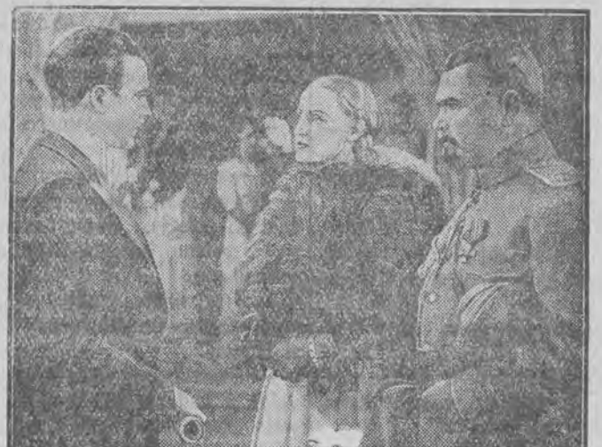
Scena z nowego filmu szpiegowskiego z Brygida Heim (pośrodku) w jednej z głównych ról