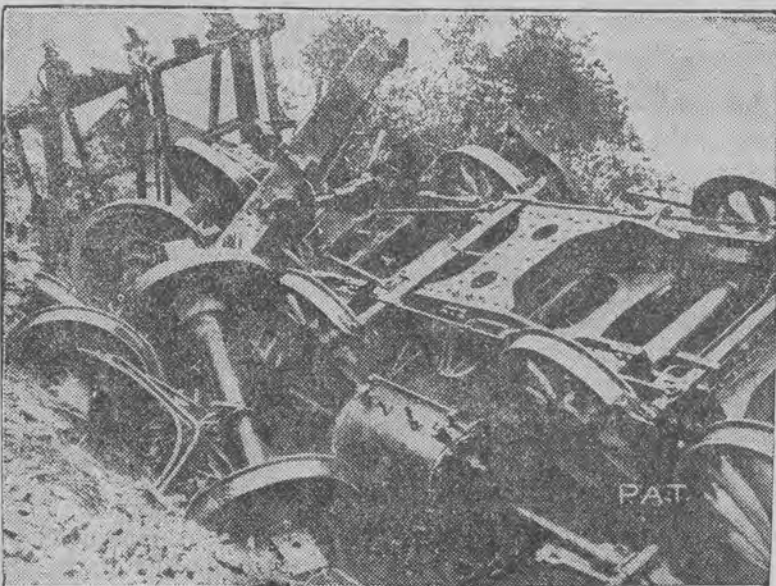
Lokomotywa leżąca w korycie rzeki Mur z powyrywanymi kołami.