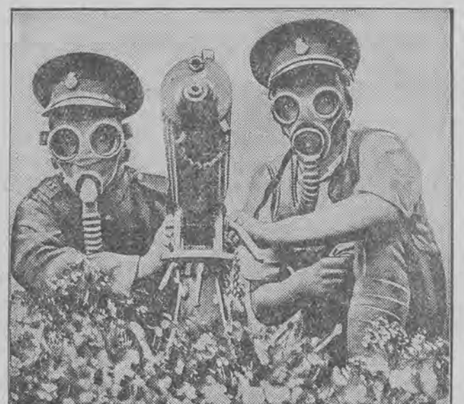
Najnowszej konstrukcji karabiny maszynowe i maski gazowe dla piechoty podczas manewrów armji angielskiej