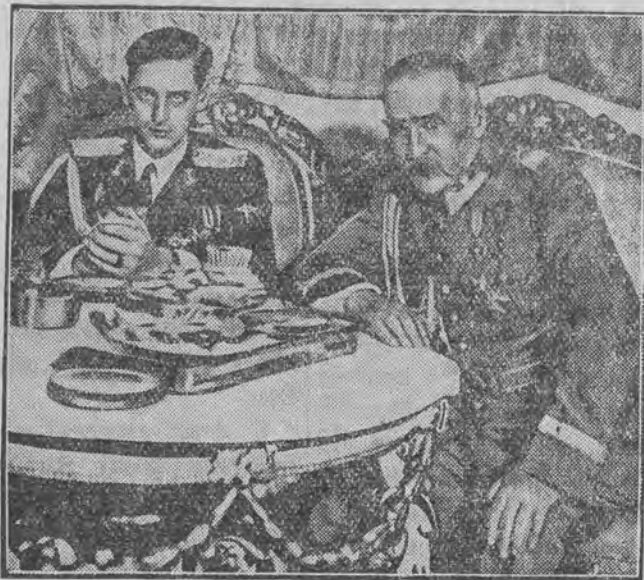
Ks, Mikołaj brat króla rumuńskiego, na audjencji prywatnej u marsz. Piłsudskiego.

nie sowieckiej spis punktów, co do których nie nastąpiło między stronami uzgodnienie. Punkty te