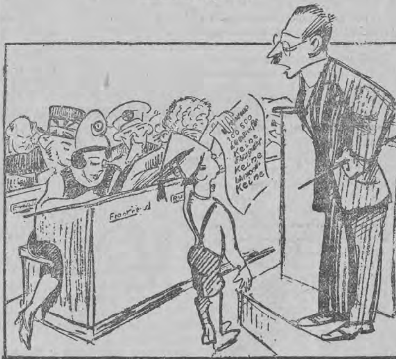
Niemiec (do nauczyciela, który wyobraża ligę narodów): Nie było mi trudno znaleźć rozwiązanie całkowitego rozbrojenia na podstawie obecnego stanu. (Karykatura niemiecka).