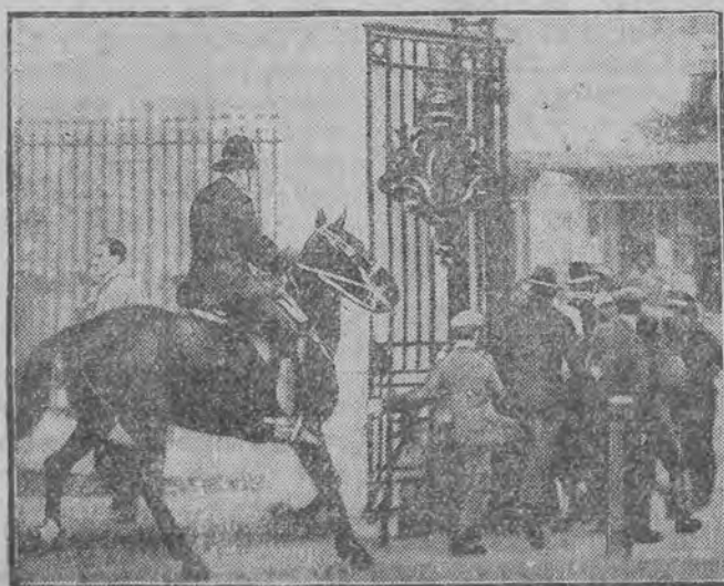
Konna policja oczyszcza okolice parlamentu londyńskiego.

LONDYN, 2 X. W Glasgowie doszło wczoraj wieczorem do BURZLIWYCH DEMONSTRACJI I WYKROCZEŃ, KTÓRE PRZECIĄGŁY SIĘ DO PÓZNEJ NOCY.