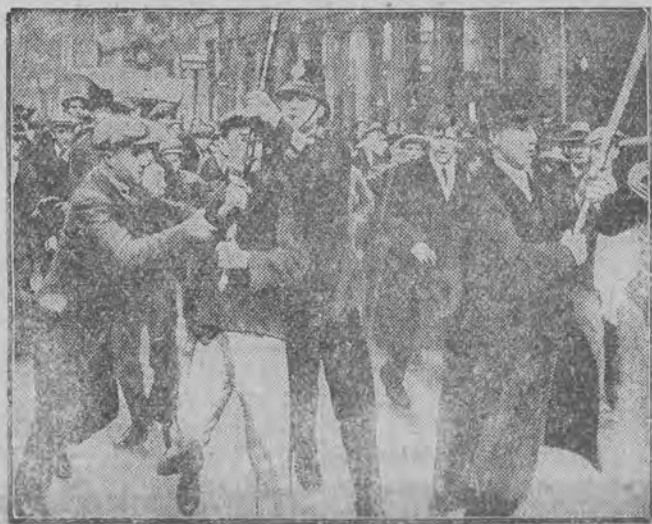
Policja usiłuje skonfiskować czerwony sztandar i zaarrestować chorążego.

BERLIN, 2 X. (PAT). — Na tle dekretu Hindenburga o