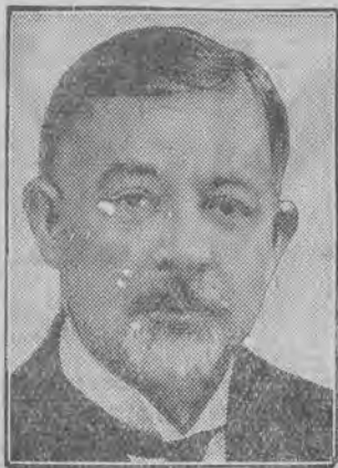
austrjacki minister finansów. zgłosił swa dymisję.