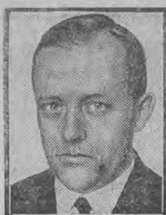
Treviranus (bez teki).