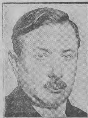
Wirth (sprawy wewnętrzne).