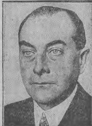
Curtius (sprawy zagraniczne).