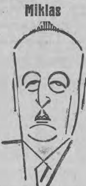
obraný ponownie prezydentem Austrii.

Po przeprowadzeniu rozprawy sąd apelacyjny obu oskarżonych z braku dowodów uniewinnił.