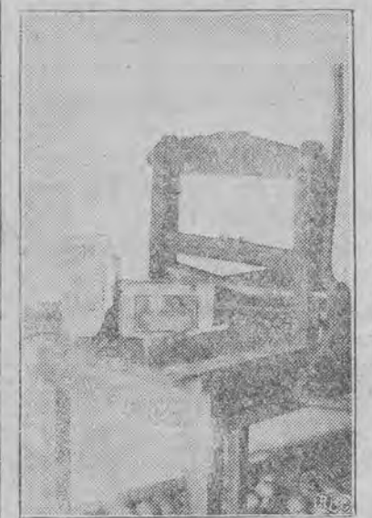
Prasa i klisze do wyciskania falszywych banknotów 500 - złotych. Pod prasą — skrzynka z jabłkami.

od prawdziwych. Trzecim charakterystycznym błędem, który spostrzec można już na pierwszy rzut oka, jest to, że koło znajdujące się po stronie orla, a w którym znajduje się wodny portret Kościuszki, jest źle