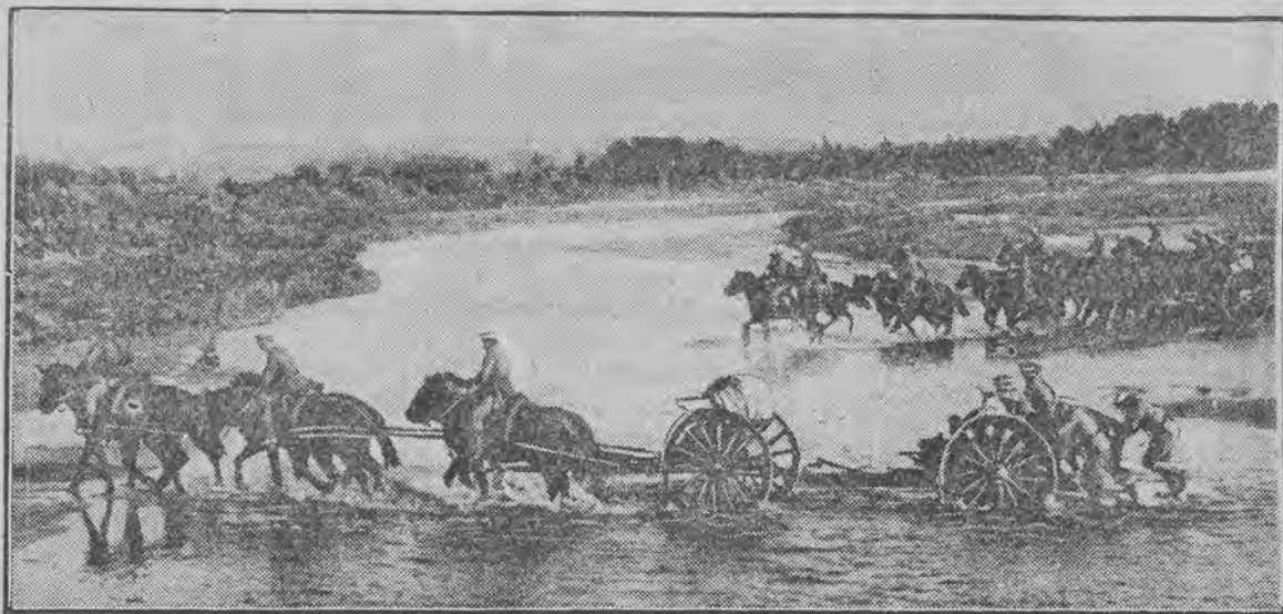
Japońska artylerja przechodzi przez rzekę Nonni.