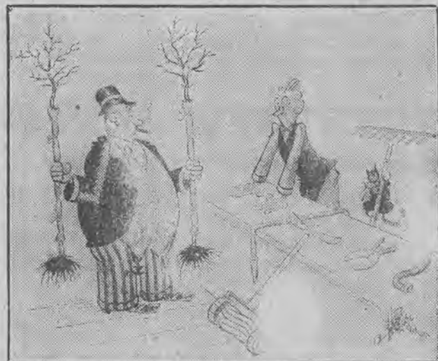
— A teraz proszę mi odrazu dać również hamak!