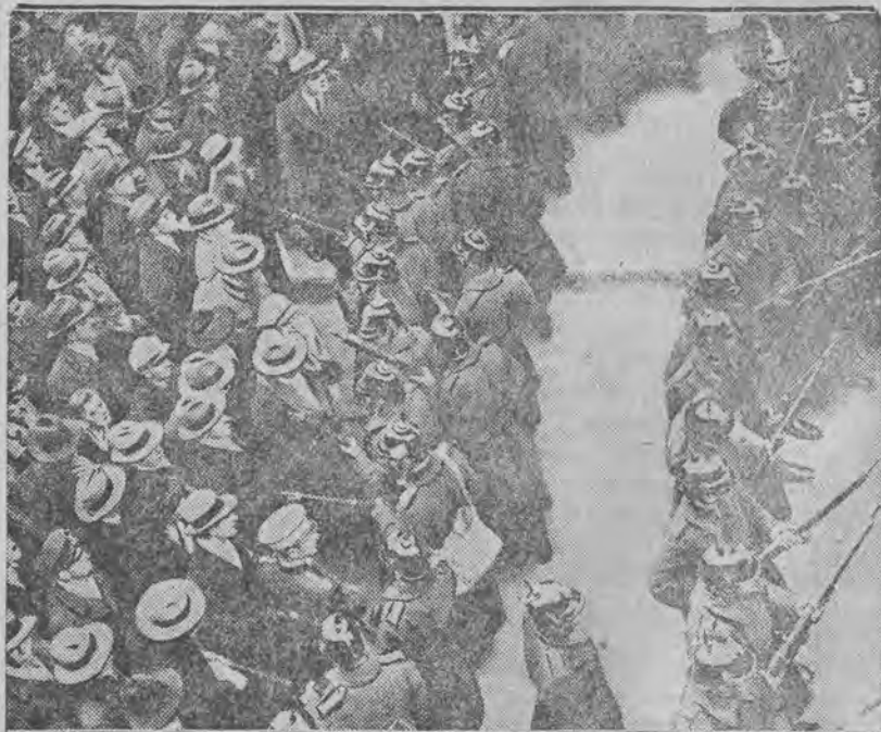
Policja rozpędza demonstrantów na ulicach Bukaresztu.