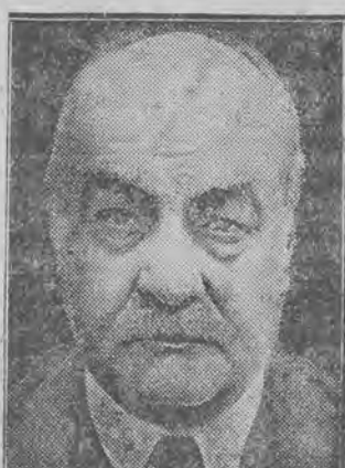
Prof. N. M. Butler

„Demokracja i etyka socjalna”, „Nowy ideał pokojowy”, „Dusza młodzieży a ulica wielkomiejska” itd.