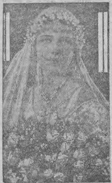
ANNA HARDING CLIVE BROOK CONRAD NAGEL