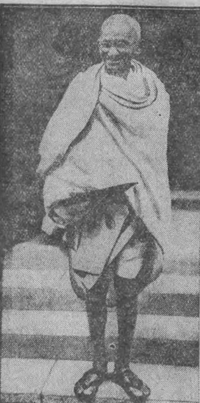
Gandhi po aresztowaniu

LONDYN, 5 I. Donoszą z Bombaju, że nowy przewodniczący wszechinduskiego kongresu, RAJANDRA PRASAD, ZOSTAŁ ARESZTOWANY w miejscowości Patna. Prasad zo-