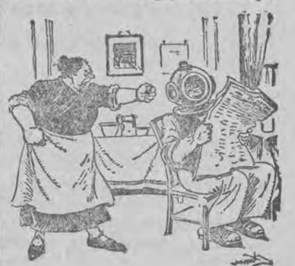
Nurek na łonie rodziny.