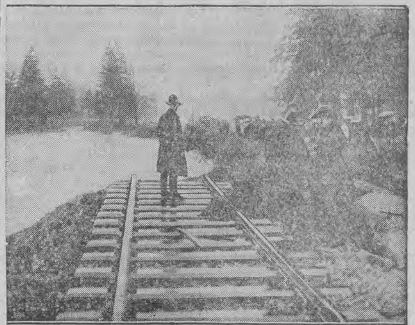
Całkowicie podmyty tor kolejowy.