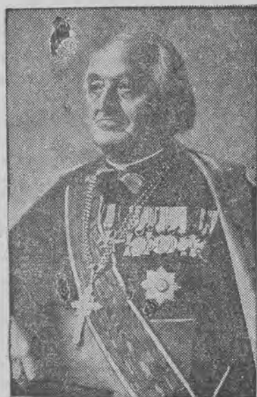
obchodzi ćwierćwiecze sakry biskupiej.