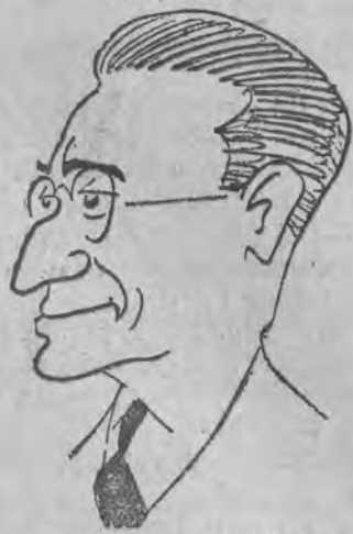
nowy hiszpański minister spraw zagranicznych