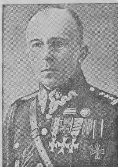
mianowany komisarzem Banku Polskiego