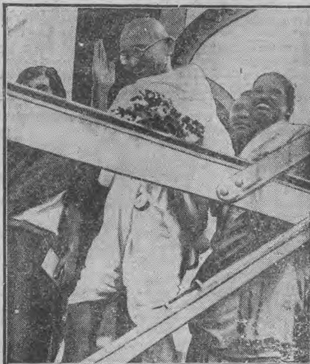
wysiada Gandhi na ląd w swej ojczyźnie po powrocie z podróży do Londynu.