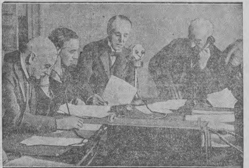
odbyła się ostatnio między angielskim ministerstwem handlu a rządem australijskim.