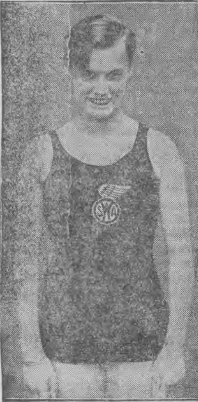
Amerykanka ustanowiła nowy rekord w pływaniu na wznak, pokrywając 150 jardów w 1 min. 53,4 s.