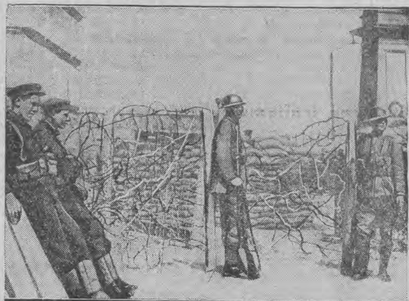
bronią terenu koncesji międzynarodowej.