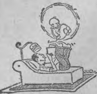
Artysta z Variete w domu.