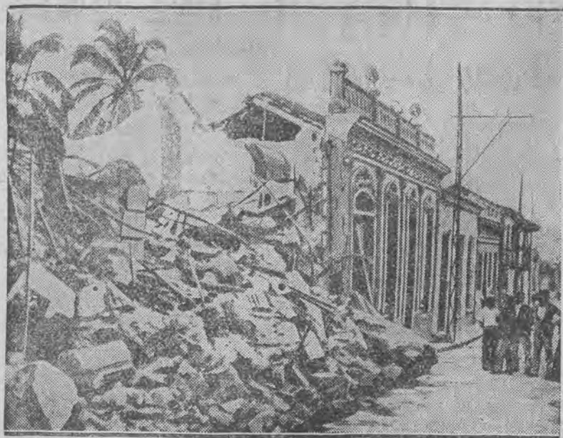
wyrządziło szczególne szkody w mieście Santiago. Pierwsze zdjęcia, dokonane po katastrofie.