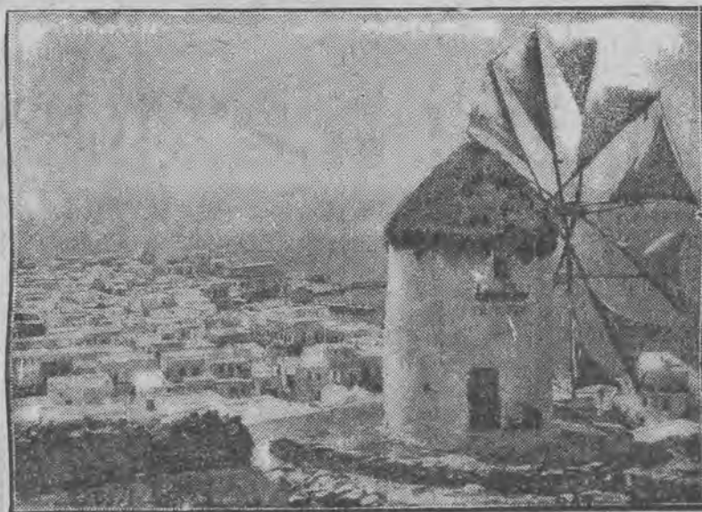
Ilustracja nasza przedstawia piękny widoczek z wyspy Mykenos (Cyklady wschodnie) ze staroświeckim wiatrakiem.