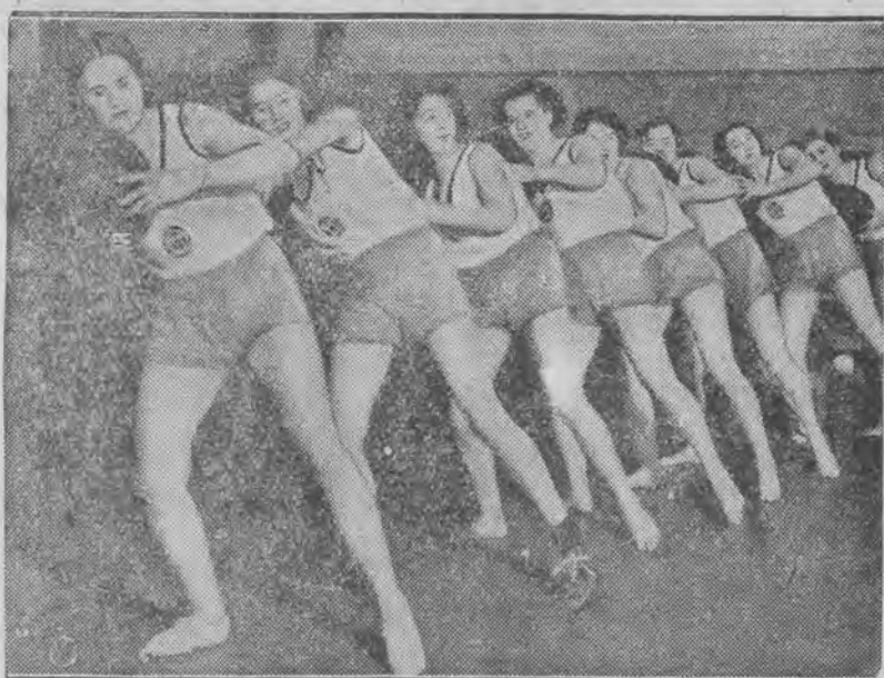
Studentki podczas ćwiczeń rytmicznych z piłką.