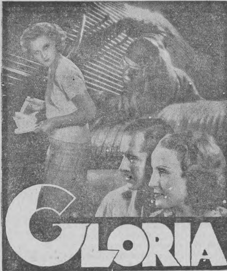
to szczęście i łzy, zmysły i obowiązek!

GLORIA — to najwspanialsza uczta artystyczna!