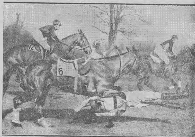
podezas wyścigów konnych we Francji. Fotograf uchwycił moment, kiedy jockey spadł przez łeb tak, że powstaje wrażenie, jakgdyby koń miał jeźdźca między nogami.