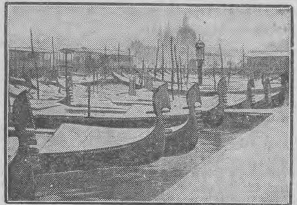
Ostatnia fala zimna objęła także uroczą Wenecję. Widzimy oto sławne gondole weneckie, pokryte śniegiem w zamarznętych kanałach.