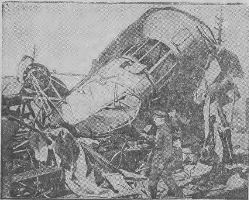
dostał się nad Nowym Jorkiem w strefę burzy i spadł na przedmieście, zupełnie zniszczony.