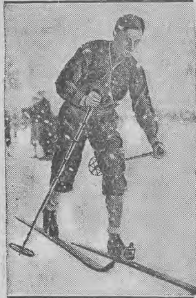
mistrz narciarski akademików niemieckich,