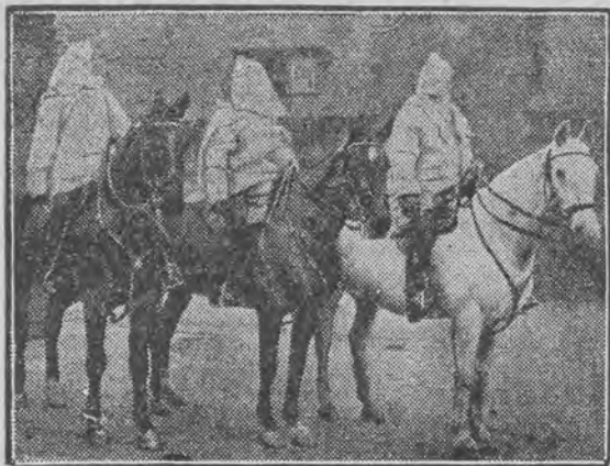
ćwiczy się w jeździe z zawiązanymi oczami.