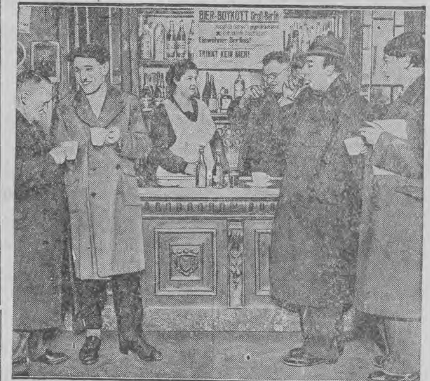
Stali bywalcy piwiarni, walcząc o zniżkę cen piwa, pijają tylko wino, kawę i wodę sodową.