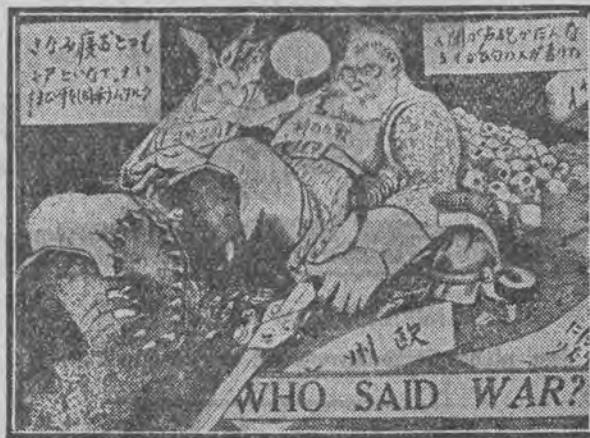
Panna Liga Narodów usypia po tęgę militarną Europę japońskim wachlarzem. (Karykatura amerykańska).

główek jest przesadny, ale go używa „dla uczercwienia sobie artykułu, dla podmalowania sobie tytułu”.