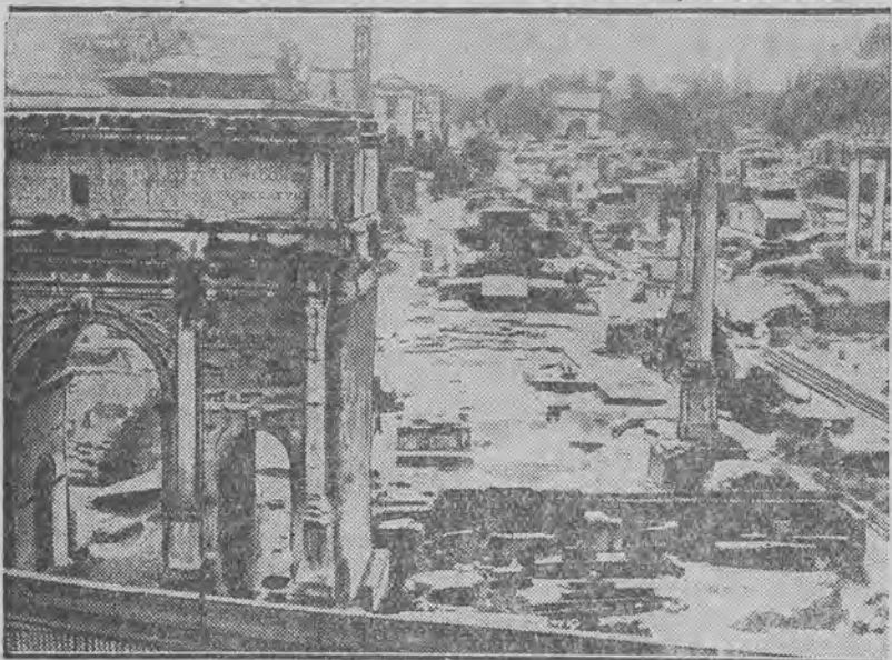
Na pierwszym planie ruiny Forum Romanum