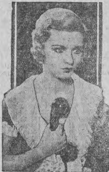
w filmie Foxa „Kajdany przeszłości”