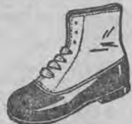
Buciki od zł. 8.75