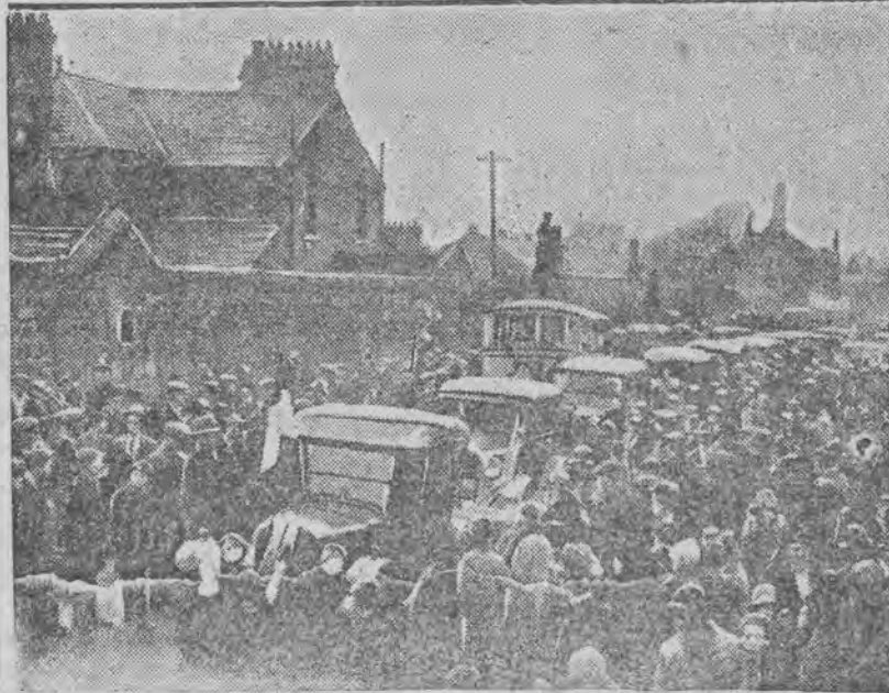
Pierwszym aktem państwowym nowego rządu Irlandzkiego była amnestja dla wszystkich przestępców politycznych.