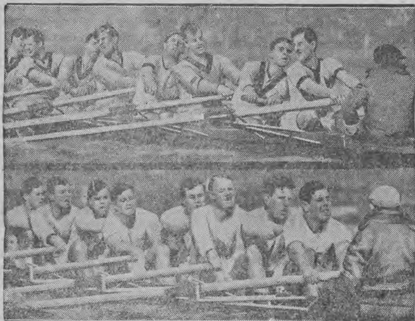
Dwie drużyny wioślarskie, które s tają w sobotę do corocznego tradycyjnego wyścigu na Tamizie.