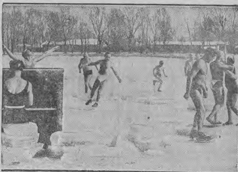
w kostjumach kąpielowych używa ją ślizgawki po zamrzniętym Dunaju.