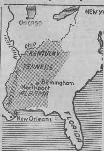
Obszar punktowany głównie ucierpiał.

W czasie tornada w stanie Georgia wicher porwał pewnego męż- czyznę i rzucił go na wierzchołek drzewa. Po ustaniu burzy znalazło no go tam z ciężkimi ranami, któ- rych się nabawił spadając na pola mane galezie. W Cleveland (Ten- nessee) pewna kobieta w przera- żeniu wybiegła z domu z dzieckiem na rękę. Wiatr wyrwał jej dziecko i wrzucił je do studni, położonej o kilkanaście metrów. Dziecko uło- żyło