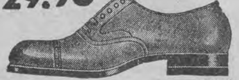
Męskie półbuciki z czarnego lub brązowego boku. Goodyear. Wygodne w noszeniu. Do nabycia w kilku szerokościach. Fason 9637-21