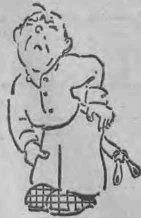
Och, do djaska! Tęgo dłużej nie wytrzymam. Teraz przeprowadzę na serjo kurację Aspiriną.

Wszystkich, zarówno organizatorów jak i grających, sprowadzono do urzędu śledczego.