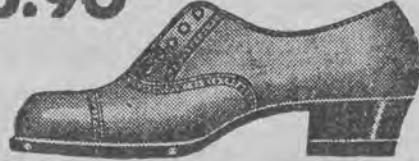
Dla Pań Szeroki wygodny półbucik na niskim skórzanym obcasie i gumie. Fason 3635-18 ZI-22-Po.