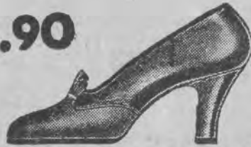
Eleganckie czółenka z brązowej lub czarnej gładkiej skóry. Najmodniejszy krój. Ozdobny leżący. Modell 9505-99