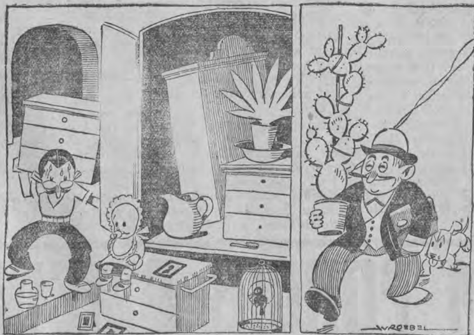
Ojciec rodziny poci się. — Kawaler pęka ze śmiechu.