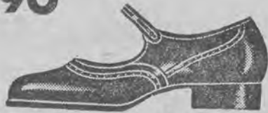
Nr. 34-38 Fason 4644-05 Praktyczny pantofelek na paseczki. Szeroki wygodny krój jest najodpowiedniejszy dla dziewczęcej nóżki.