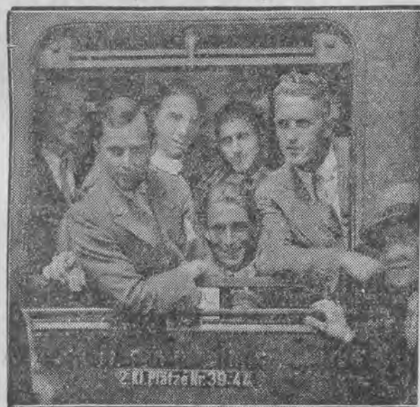
wyjeżdża na olimpiadę do Los Angeles