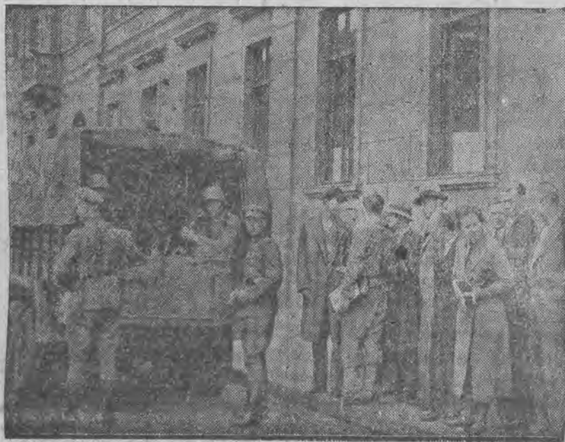
GMACH PRUSKIEJ RADY MINISTRÓW

Ministrowie oznajmili urzędnikom, że NIE UZNAJĄ DEKRETU HINDENBURGA, a usunięcie ich ze stanowisk jest nie zgodne z konstytucją. Dodali przytem, iż nie godzą się na rozporządzenia v. Papena i przystępują do zwykłych zajęć, które może przerwać jedynie akt przemocy.