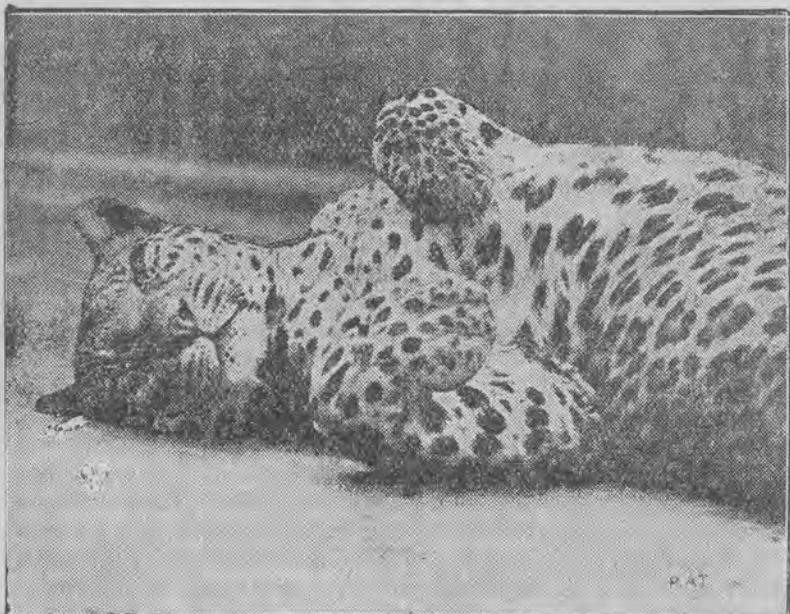
Na zdjęciu naszym widzimy młodego tygrysa Mudy z ogrodu zoologicznego w Londynie w czasie poobiedniej drzemki.

ŁÓDZ, PIOTRKOWSKI Glisze 100 do Reklam Gazetowych Cenniki, Formy, Prospektów Złoty, reklamowane dla celów reprodukcyjnych Usługi, projekty reklamowe (wzrosty, kłace, pułapki)