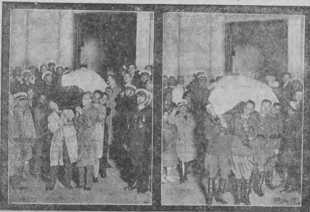
Oficerowie 1 p. lotn. niosą na barkach trumnę ze zwłokami ś. p. por. Żwirki (na prawo). Trumnę ś. p. inż. Wigury dźwigają koledzy jego z sekcji lotniczej politechniki warszawskiej (na lewo).