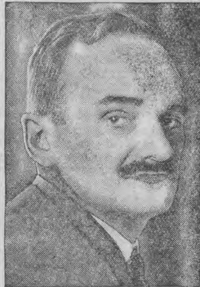
nowy wiceminister w prezydium rady ministrów.