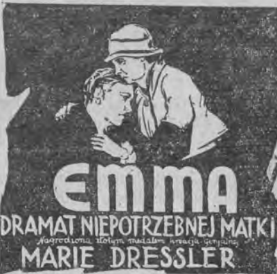
Film nagrodzony złotym medalem.

Delegaci innych związków je dnomyślnie opowiedzieli się za powołaniem międzyzwiązkowej komisji dla przeprowadzenia akcji ekonomicznej w przemyśle. W tym celu postanowiono rozpocząć pertraktacje z innymi organizacjami włóknarzy na terenie Łodzi dla omówienia dalszej taktyki i ewentualnego przejęcia steru akcji przez komitet międzyzwiązkowy. Jednym ze środków walki miałyby być strejk ogólny w przemyśle włókienniczym Łodzi i okręgu. Jak się dowiadujemy, pertraktacje międzyzwiązkowe w tej sprawie mają rozpocząć się w początku przyszłego tygodnia.