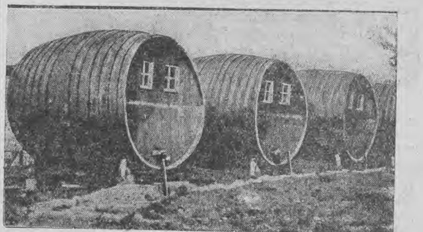
Pod miastem Vermillion w stanie Ohio wielu mieszkańców urządziło sobie locum bezpłatne w wielkich beczkach od wina.