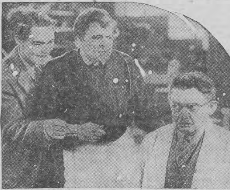
RICHARD CROMWELL, MARIE DRESSLER and JEAN HERSHOLT w „EMMA”