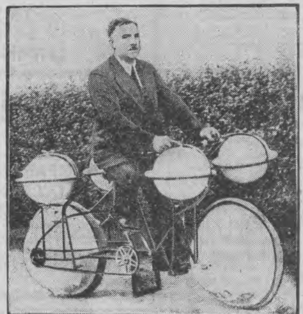
Rower, nazwany przez swego wynalazcę „Cyclomer“, porusza się z równą łatwością po szosie i po falach rzeki, czy morza.