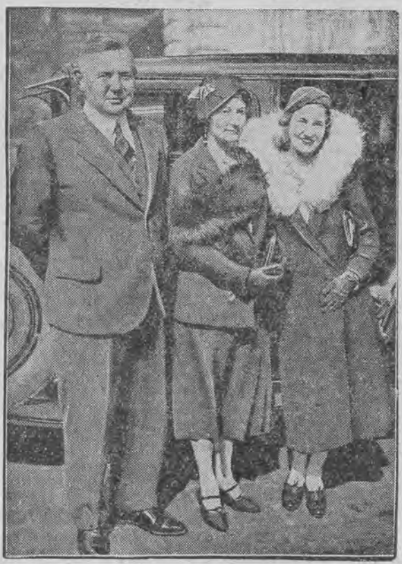
południowo - afrykański minister kopalń i przemysłu, przybył z żoną i córką na dłuższy pobyt do Europy. Fourie brał udział w konferencji w Ottawie, skąd wraca obecnie do ojczyzny.