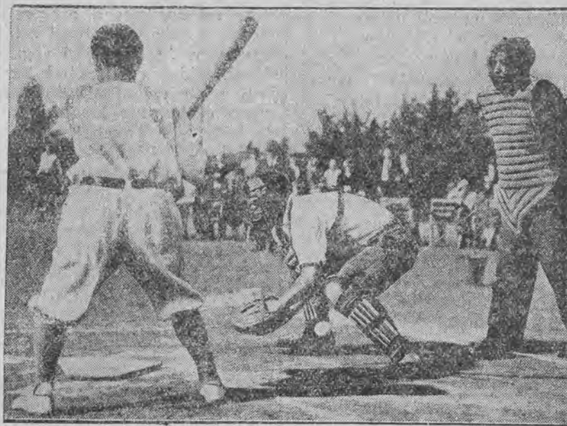
zawodników, biorących udział w meczu narodowej gry amerykańskiej „baseball”.