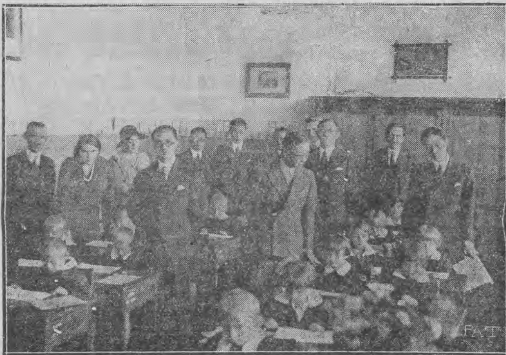
Chińska misja oświatowa, przybyła do Polski dla prze studjowania organizacji szkolnictwa. — Na ilustracji naszej widzimy pedagogów chińskich w jednej z warszawskich szkół powszechnych.