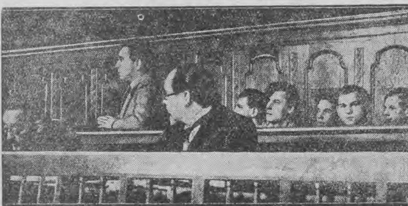
wielkiego procesu 9 komunistów, oskarżonych o zamordowanie hitlerowca. Proces ten toczy się obecnie w Berlinie. Na ławie oskarżonych słada właśnie zeznania główny winowajca, Calm.

PRYWATNE POGOTOWIE LEKARSKIE tel. 12-333