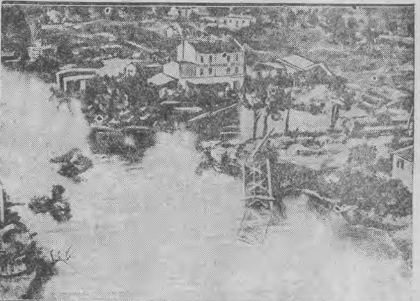
Tragiczne ślady trąby powietrznej, która szalała na Riwierze. Zdjęcie nasze, przedstawiające zniszczone i zatopione miasteczko Saint - Maxime, dokonane zostało z samolotu.