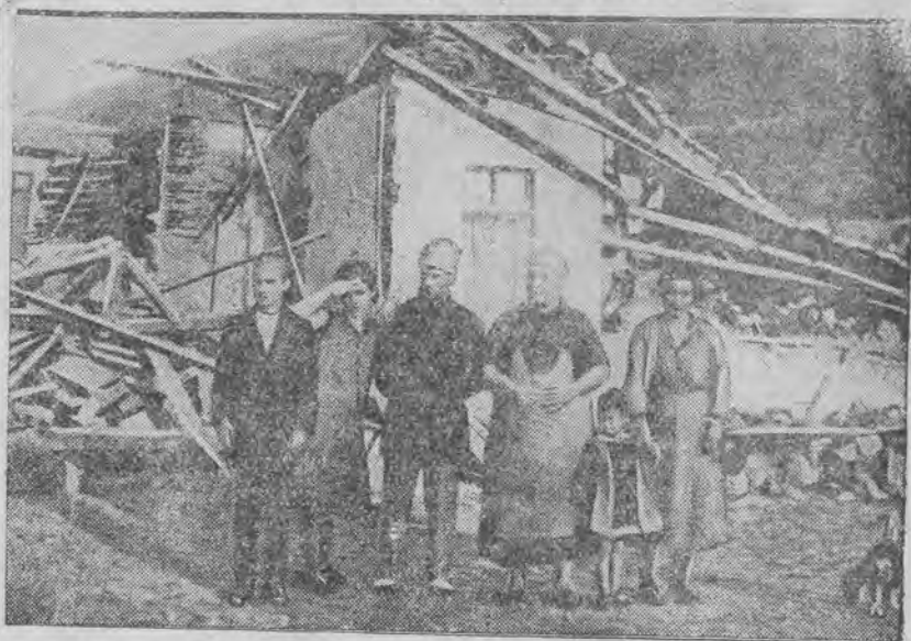
Obraz zniszczenia po trzęsieniu ziemi w jednej z wiosek greckich.