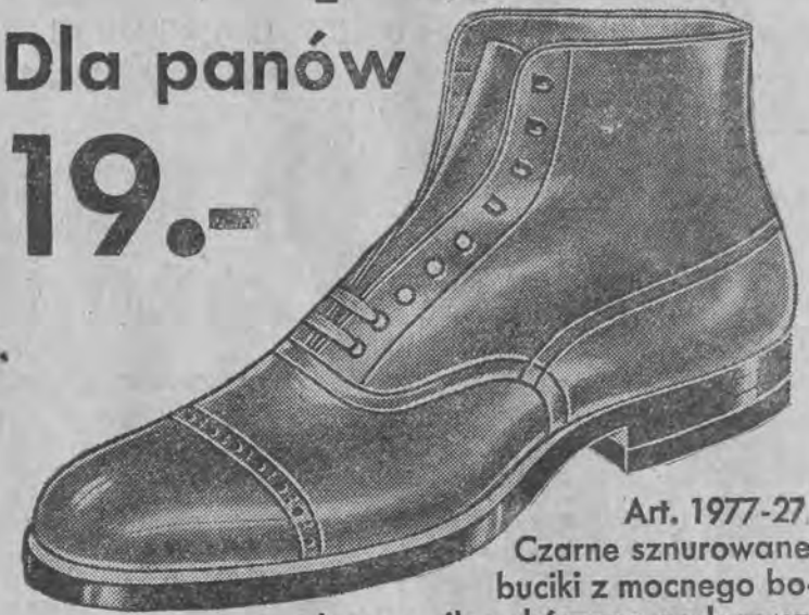
Art. 1977-27. Czarne sznurowane buciki z mocnego boksu, ze silną skórzaną podszewką.