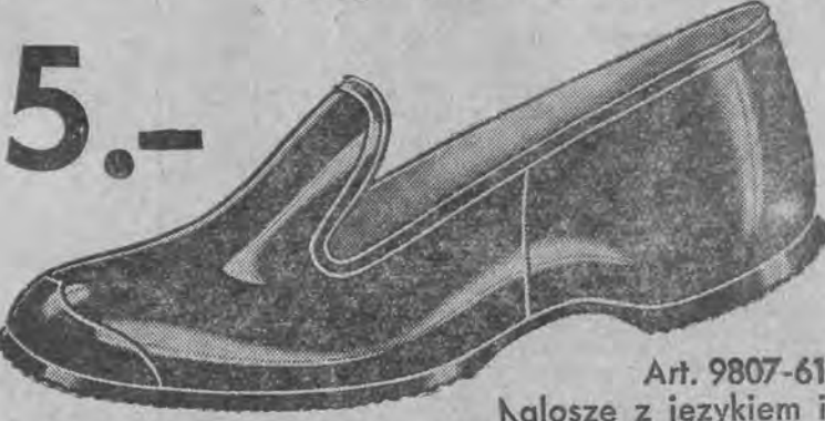
Art. 9807-61 Kalosze z językiem i bez języka. W największym błocie zachowacie suche obuwie.