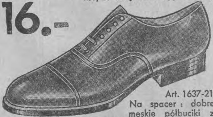
Art. 1637-21 Na spacer: dobre męskie półbuciki z czarnego lub brązowego boksalku.