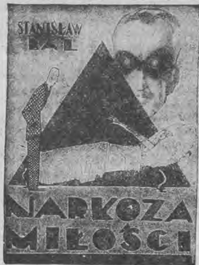
Do nabycia we wszystkich księgarniach

W końcu ubezpieczeni domagają się powołania komisji rewizyjnej z członków kasy. Wreszcie ubezpieczeni oświadczają iż w wypadku nieuwzględnienia powyższych postulatów zmuszeni będą przystąpić do bojkotu kasy.