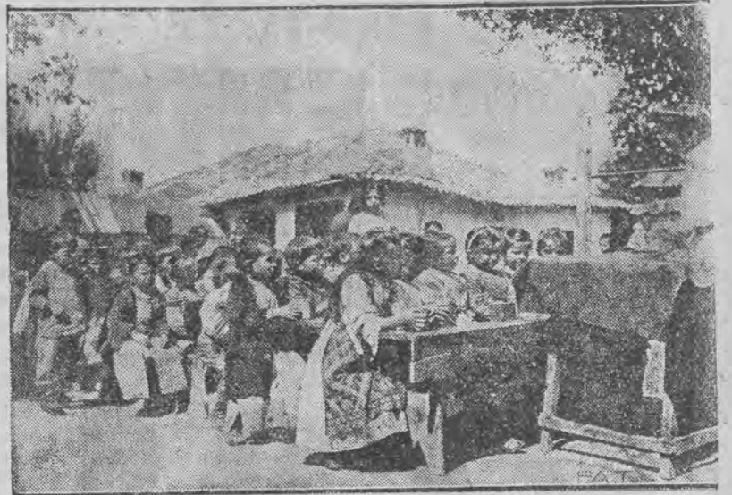
W Stratonikach, z powodu zniszczenia szkoły przez trzęsienie ziemi, lekcje odbywają się pod gołym niebem.