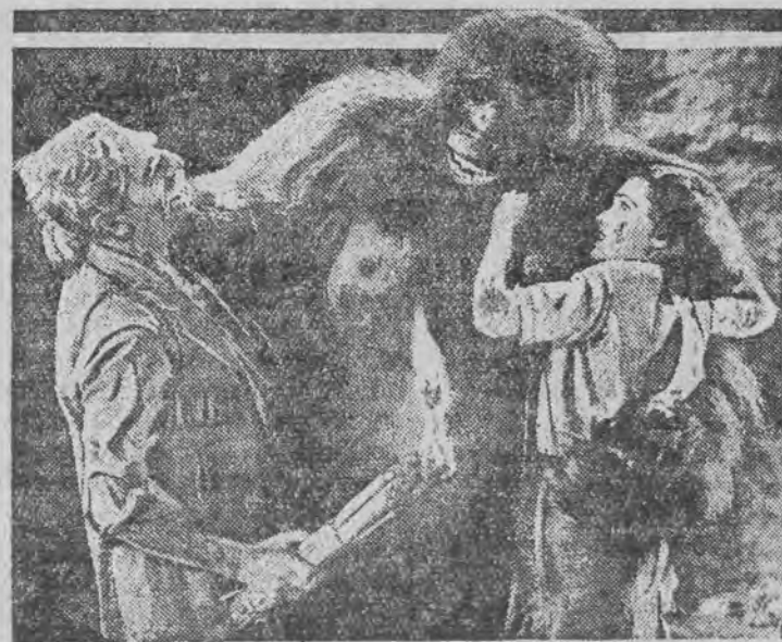
Jedna z kapitalnych scen najnowszego filmu egzotycznego Van Dyke'a p. t. "Człowiek z Małpą"

Zainteresowanie meczem osiąga punkt kulminacyjny: dotychczas z ogólnej liczby 10 tysięcy miejsc sprzedano już w przedsprzedaży 3.000 biletów i istnieje przypuszczenie, że dużo publiczności odejdzie w dniu meczu od kasy. Fakt ten wskazuje jak wielkim i potężnym argumentem propagandowym byłoby dla Polski ewentualne zwycięstwo. Zainteresowanie meczem wzrasta nie tylko w samym Dortmundzie. Dyrekcja hali, w której odbędą się zawody, otrzymała zawiadomienie, iż organizowane są specjalne wycieczki z Holandji i pogranicza. Również specjalne wycieczki szykuje młodzież polska z Westfalji i Nadrenji.