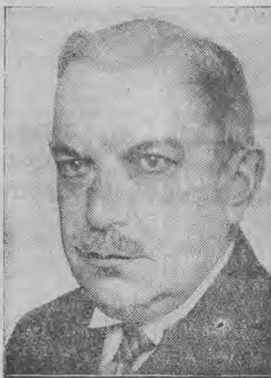
DIETRICH (partja państwowa)