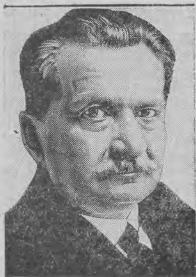
OTTO WELS (socjaliści)