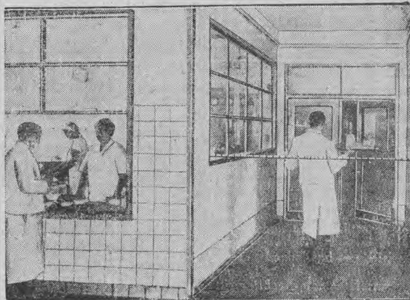
Najnowsze zastosowanie niewidzialnych promieni: gdy człowiek — w danym wypadku kelner — krzyżuje ścieżkę niewidzialnych promieni włączają one kontakt, który otwiera widoczne w głębi drzwi do lokalu.