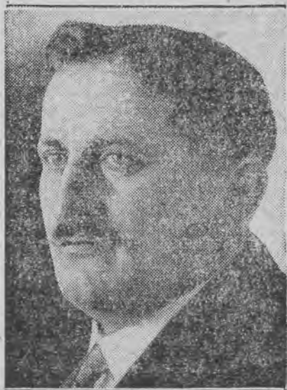
SIMPFENDORFER (chrześc. - społecz.)

W Schwaninie narodowi socjaliści wywiesili na gmachach publicznych i państwowych swoje flagi partyjne.