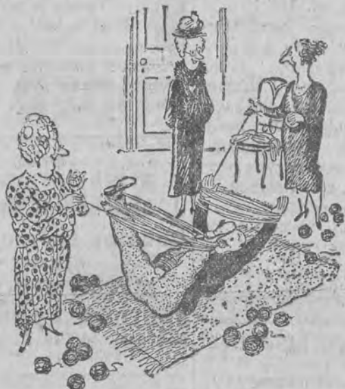
Co musi umieć idealny mąż.

Usuwanie piegów, wągrów i zmarszczek. — Racjonalny masaż twarzy. — Niezawodne wskazówki w dziedzinie pielęgnacji cery.