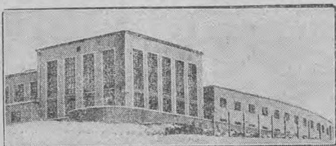
Nowa radjostacja wiedeńska.

Woda gorzka „Franciszka-Józefa” — jest stosowana z doskonałym skutkiem zwłaszcza u połońnic.