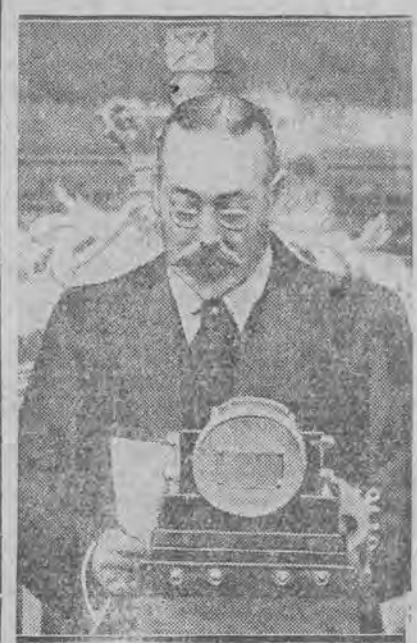
przemówił po raz pierwszy do mikrofonu. Mowa jego była transmitowana przez wszystkie stacje kołnizji brytyjskich.