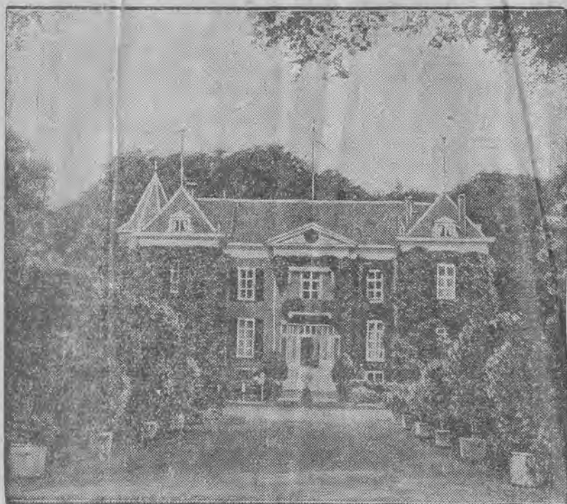
W holenderskiej siedzibie ex-kaisera aresztowano niemieckiego obywatela, który planował zamach na ex-monarchę.