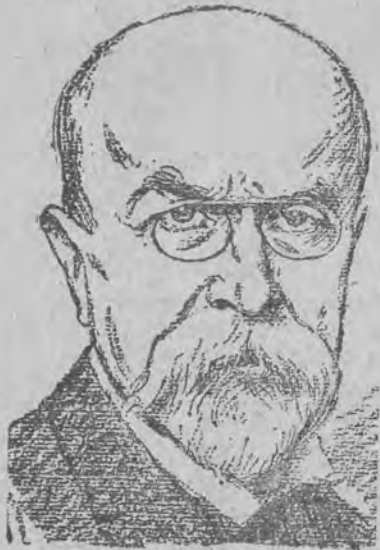
ciężko zachorował na grype.