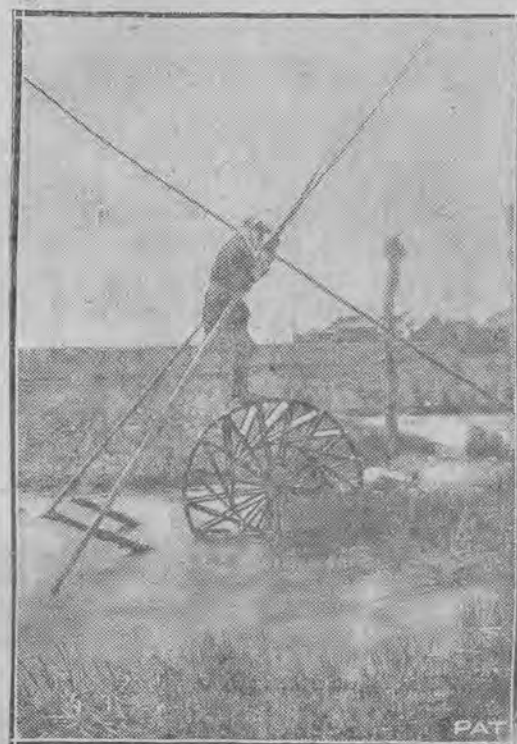
jest dotąd używany na prowincji japońskiej.