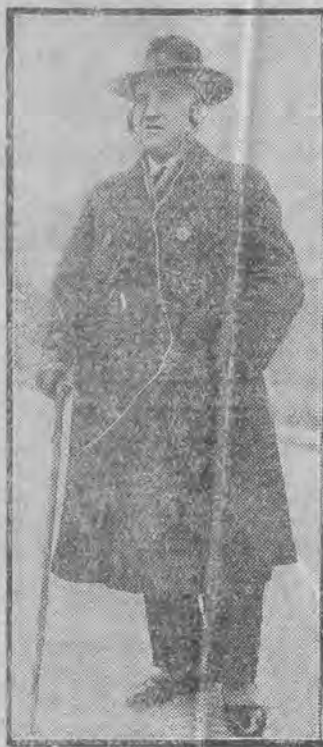
Pewien technik wbudował aparat w lasce i słucha audycji w czasie przechadzki.