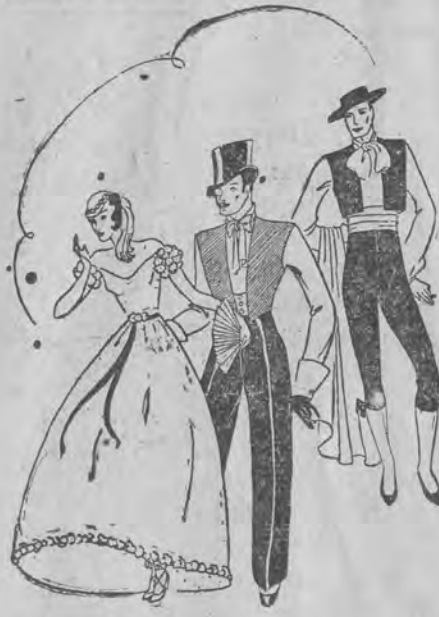
Marlena Dietrich, Postillion d'amour, maharadza, Biedermajer, galant, toreador.