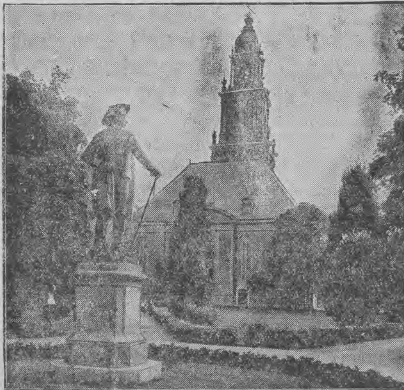
gdzie ma się zebrać Reichstag, który zostanie wybrany w niedzielę.