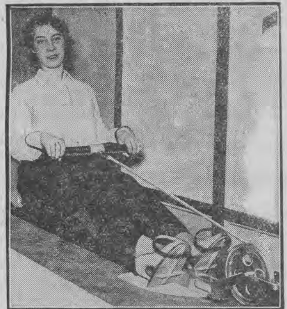
do treningu wioślarskiego