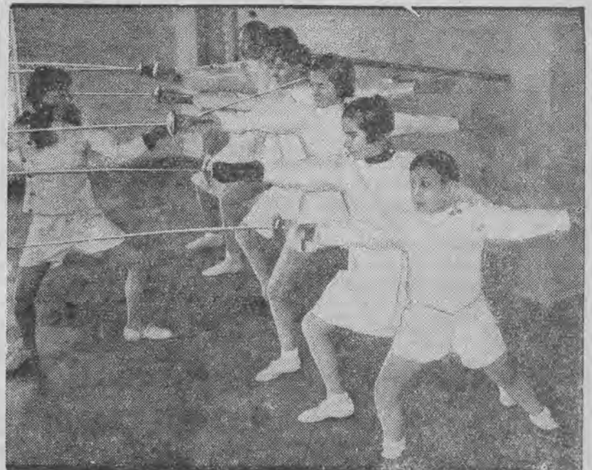
ma być zaprowadzony, jako przedmiot obowiązkowy, na Węgrzech