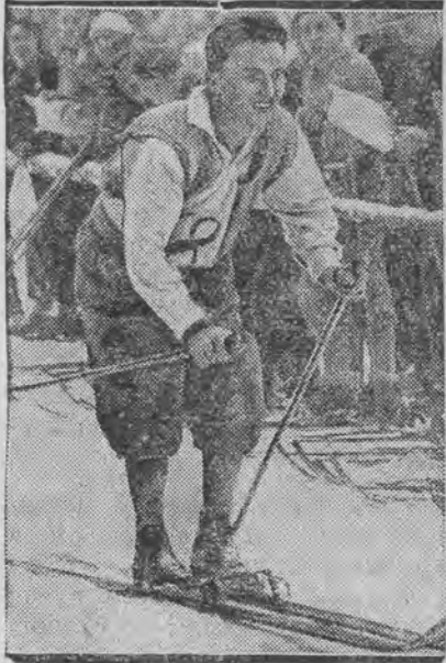
wygrał 50-kilometrowy bieg narciarski w Baiersbronn