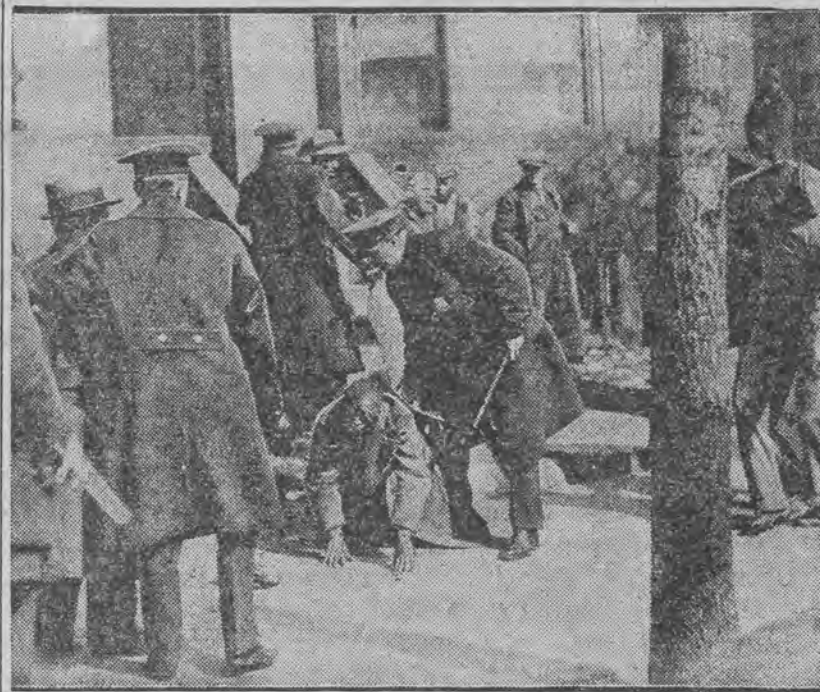
między demonstrującymi bezrobotnymi i policją w Waszyngtonie.