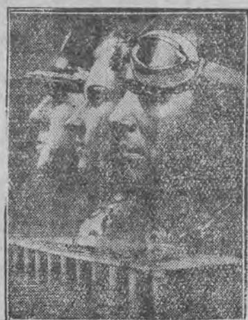
F. p. 1 nie odpowiada