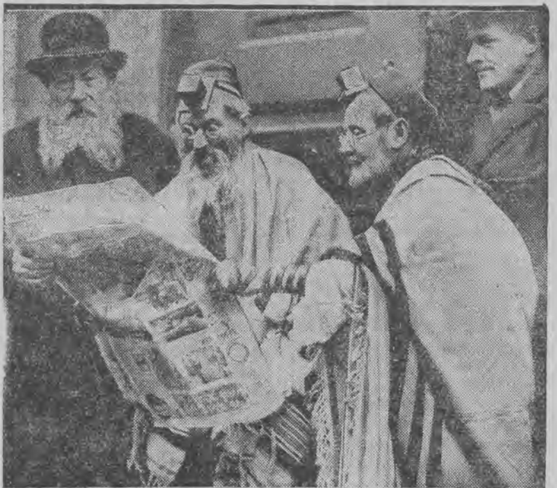
z wielkim zaniepokojeniem studują w domu modlitwy właścicieli o barbyństwach hitlerowskich.