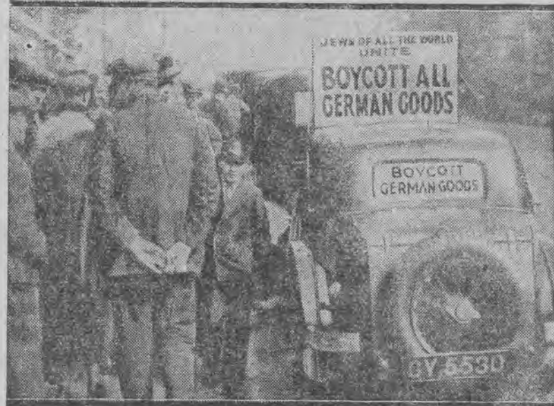
Po Angli kursują tysiące samochodów z napisami propagandowymi: „Żydzi całego świata, łączcie się! Bojkotujcie niemieckie towary”