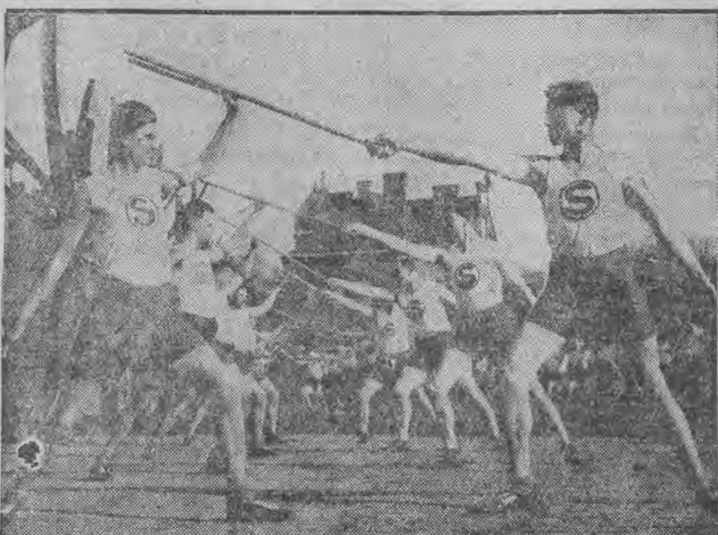
Ćwiczenia gimnastyczne policji niemieckiej.