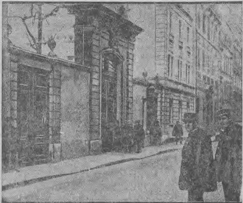
Siedziba przedstawicielstwa dyplomatycznego Rzeszy jest czujnie strzeżona, aby zapobiec ewentualnym wystąpieniom antyhitlerowskim.