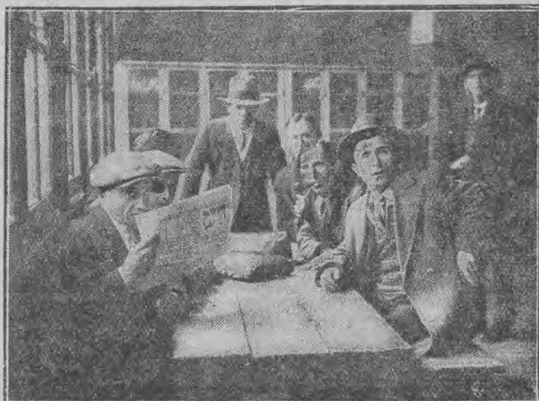
UCIECZKA PRZED TERROREM.

Ten plakat był przyklejony na oknie wielkiego magazynu gotowych ubrań.