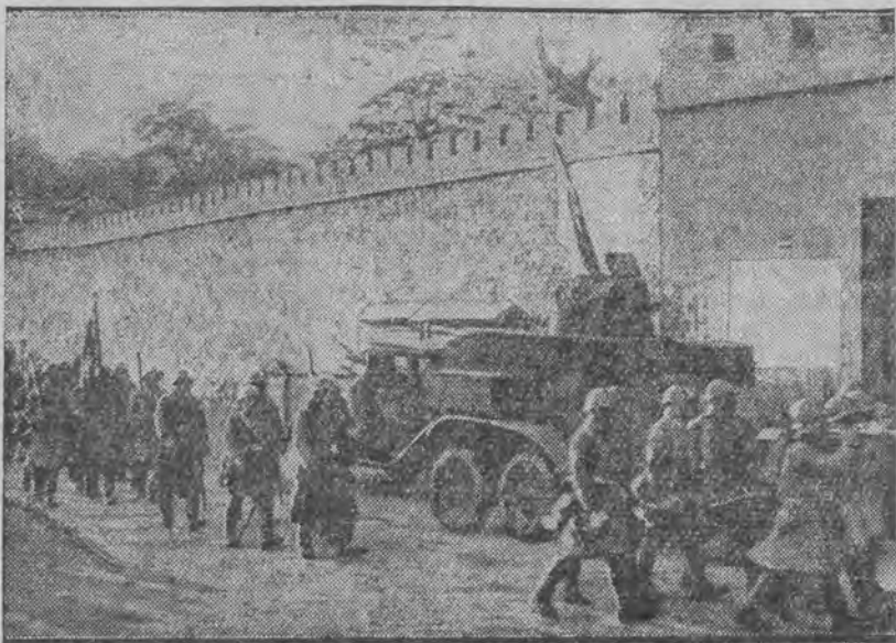
wkraczają z muzyką przez wrota miejskie do Jeholu.