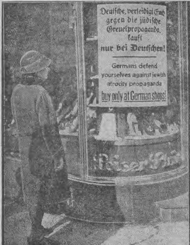
AFISZE NIEMIECKO - ANGIELSKIE

Po zamknięciu sklepów żydowskich, szturmowcy mieli mało roboty, to też zwrócili się z całą energią przeciwko żydom wolnych zawodów — adwokatom, lekarzom i t. d. Na szyldach tych osób, w bramach i na ścianach domów przyklejano czerwone plakaty z napisami: „Zabrania się odwiedzać adwokata, czy lekarza żyda!” Zresztą już od rana