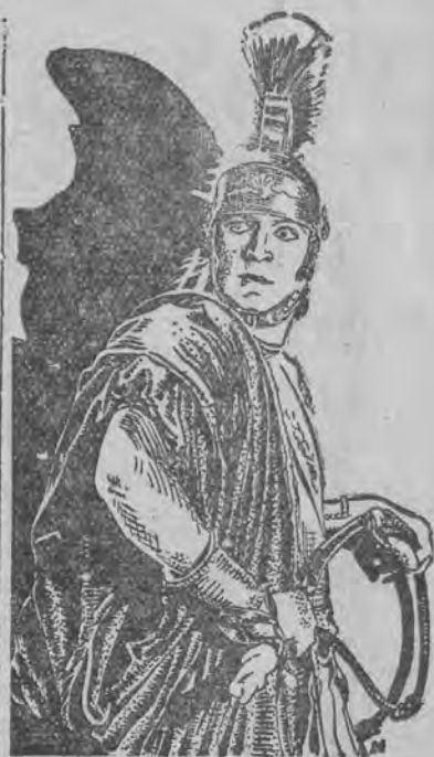
Król reżyserów Cecil B. de Mille