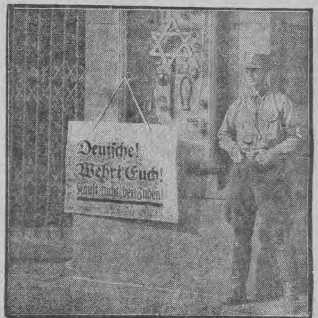
WEJŚCIE DO SKLEPU ŻYDOWSKIEGO. w dniu bojkotu na terytorjum Niemiec.

Niestychanie ostry terror hitlerowski zmusił setki i tysiące obywateli niemieckiego pochodzenia żydowskiego do ucieczki poza granice Rzeszy. Na zdjęciu naszym widzimy grupę uciekinierów żydowskich z Niemiec, którzy znaleźli schronienie w specjalnie utworzonych dla nich schroniskach w Paryżu.