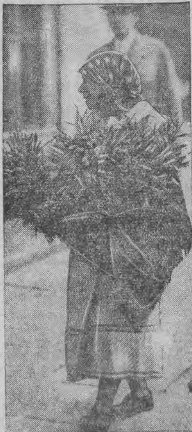
Od kilku dni wije się po ulicach miasta wieśniaczka, sprzedająca zwiastuny wiosny, pospolite „bazie”.