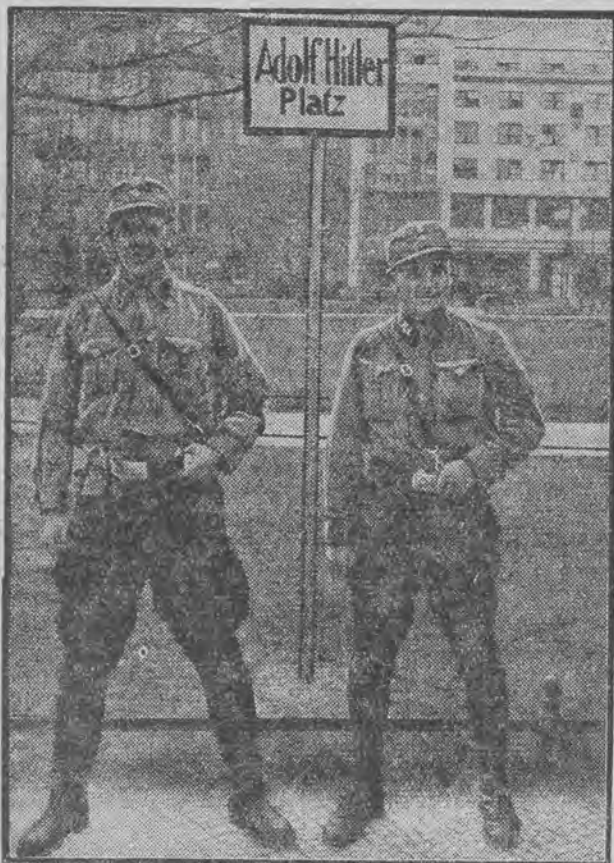
Plac kanclerza Rzeszy w Berlinie został nazwany imieniem Adolfa Hitlera.