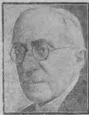
prezydent senatu gdańskiego.