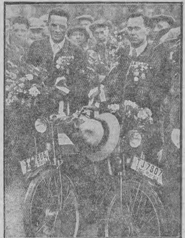
którzy na lekkich maszynach przebyli 23 tys. kilometrów z Afryki południowej do Berlina.