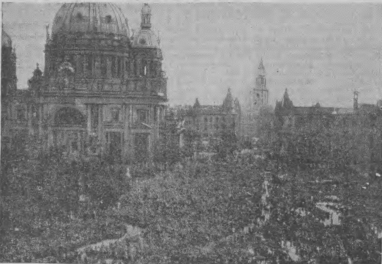
Nieprzejrzane tłumy przysłuchują się przemówieniu Hindenburga.