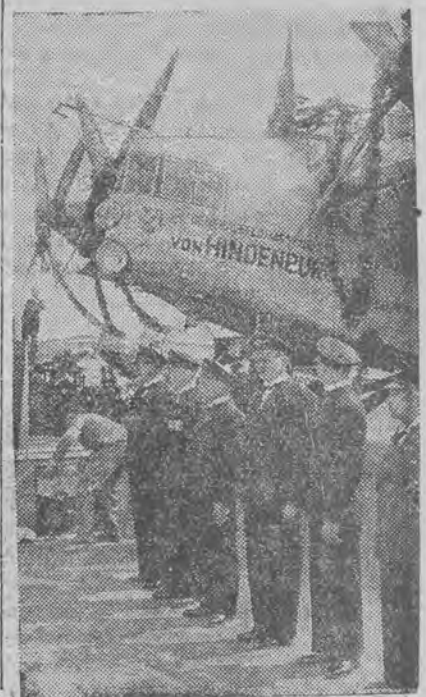
został obecnie oddany do użytku publicznego, a sędziwy prezydent Rzeszy był obecny przy uroczystości chrztu.