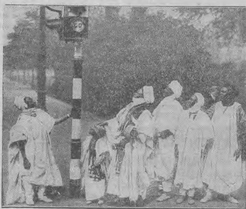
Tak prawdopodobnie myślą sobie poczciwi arabowie, oglądając współczesne sygnały komunikacyjne na ulicach Londynu.