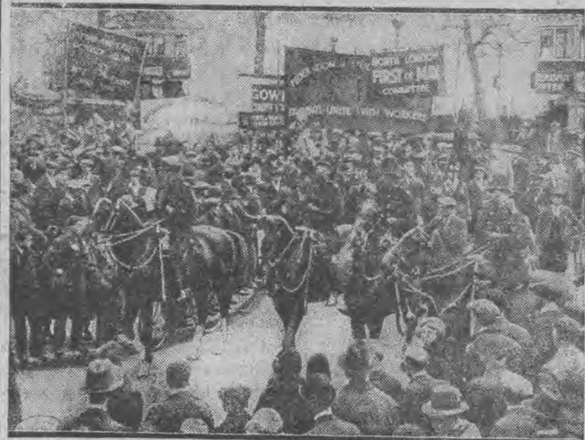
Pochód demonstracyjny robotników pod osłoną policji zmierzają do Hyde - Parku.