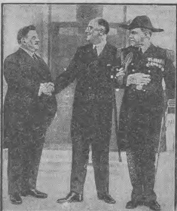
podczas ostatniego pobytu w Waszyngtonie. Na prawo adiutant morski prezydenta Stanów Zjednoczonych.