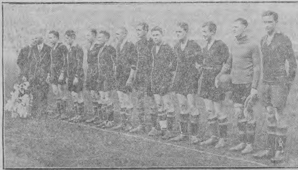
W dniu 17 b. m. odbędą się w Brukseli w obecności króla belgów Alberta zawody w piłkę nożną pomiędzy reprezentacyjną drużyną Belgii, a polską drużyną „Wisła”. Na zdjęciu naszym widzimy reprezentacyjną drużynę belgijską.