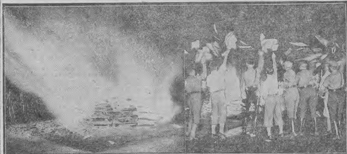
Scena masowego palenia ksiąg na Placu Opery w Berlinie przez oddziały hitlerowców.

ustawiono na dziedzińcu uniwersytetu, aby na nim umieszczać nazwiska tych studentów i profesorów, którzy wypowiedzieli się przeciwko hitlerowskiej barbarii.