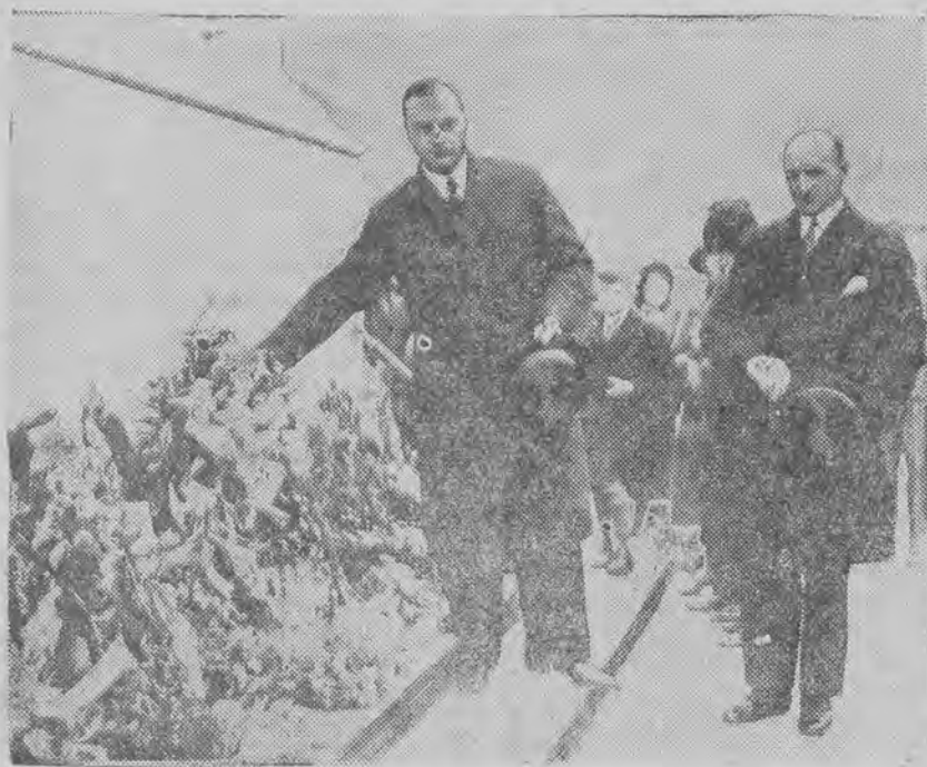
Wysłannik Hitlera dr. Rosenberg składa na grobie Nieznanego Żołnierza w Londynie wieniec ze swastyki, który wywołał oburzenie Anglików