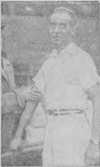
Włody tenisista berliński, osiągnął na ostatnim turnieju doskonałe rezultaty.