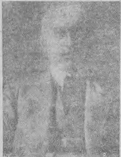
ambasador R. P. w Angorze, zmarł nagle.