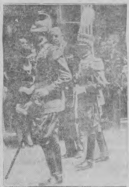
Król włoski w towarzystwie ministra oświaty (na lewo obok niego) opuszcza otwartą w tych dniach wystawę po dokładnym jej zwiedzeniu.