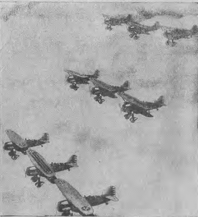
Interesujące zdjęcie z manewrów w amerykańskiej floty powietrznej.