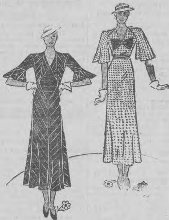
Elegancka sukienka popołudniowa

Komplet z jedwabiu w paski. Sukienka z półdługimi rękawami, zakończonymi kłozową falbaną. Deseń na plecach przebiega tak, jak na przodzie. Do tego szeroka narzutka bez paska i bez rękawów, z tego sa-