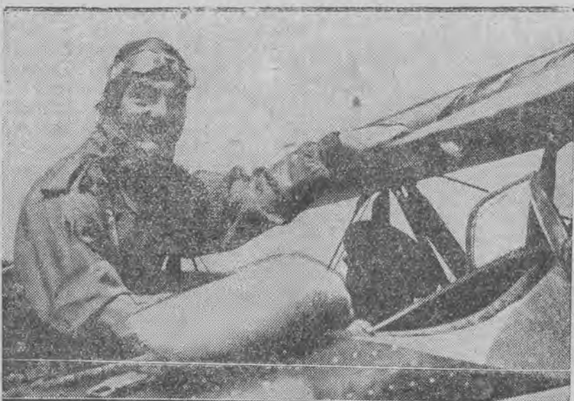
Ustanowił nowy rekord świata wy na plecach bez przerwy 1 godzinę i 6 minut.