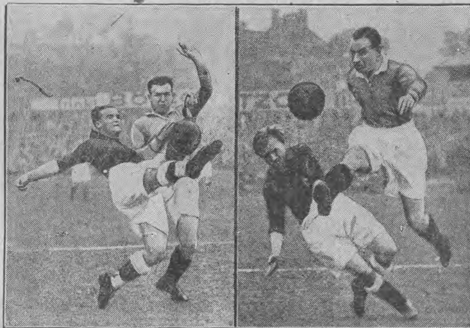
Dwa frapujące momenty z meczów, rozegranych w Berlinie przez mistrzowską drużynę szkocką Glasgow Rangers. W jednym i drugim wypadku chwila walki niemieckich bramkarzy ze szkockimi napastnikami, za każdym razem kończąca się tryumfem szkotów. —