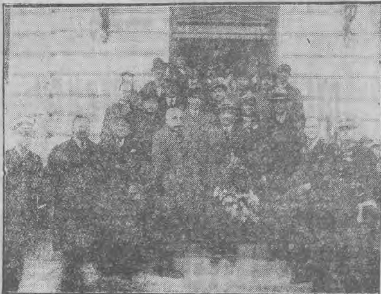
Politycy jugosłowiańscy na ziemi polskiej

W związku z wizytą parlamentarzystów jugosłowiańskich w Łodzi zarząd stowarzyszenia polsko - jugosłowiańskiego prosi wszystkich członków aby stawili się w dniu 16 b. m. o godz. 7.30 na dworcu Łódź - Kaliska, celem przywitania gości.