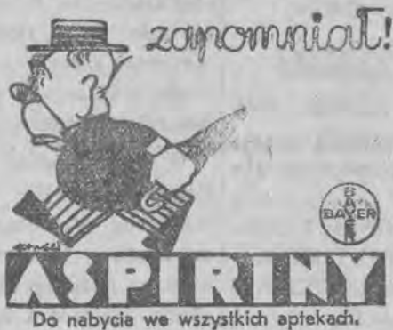
Do nabycia we wszystkich aptekach.

było wiadomo, że nie da żadnego wyniku; ceny surowców i produktów gotowych spadły poniżej wszelkich przewidywań, tak iż nastąpiło zahamowanie produkcji, a jedno cześnie bezrobocie we wszystkich krajach rozlało się szeroką falą.